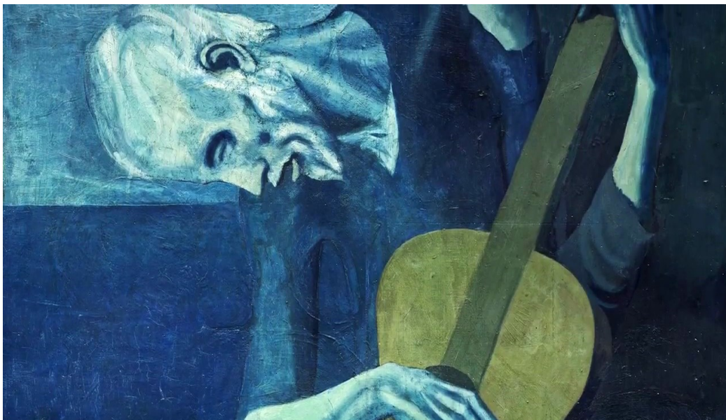
Photogramme documentaire Young Picasso de Phil Grabsky