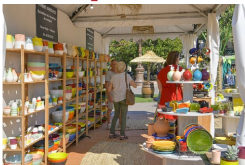
Marché de la céramique et des Santons d'Aubagne

En pays d'Aubagne et de l'Etoile, art et artisanat se confondent dans un savant mélange. Les cheminées des briqueries et tuileries ne fument plus. Mais les artisans céramistes et santonniers eux, perpétuent une traditions séculaire dans de nombreux ateliers d'artistes. Quoi de plus normal d'évoquer la céramique de Picasso à Aubagne.